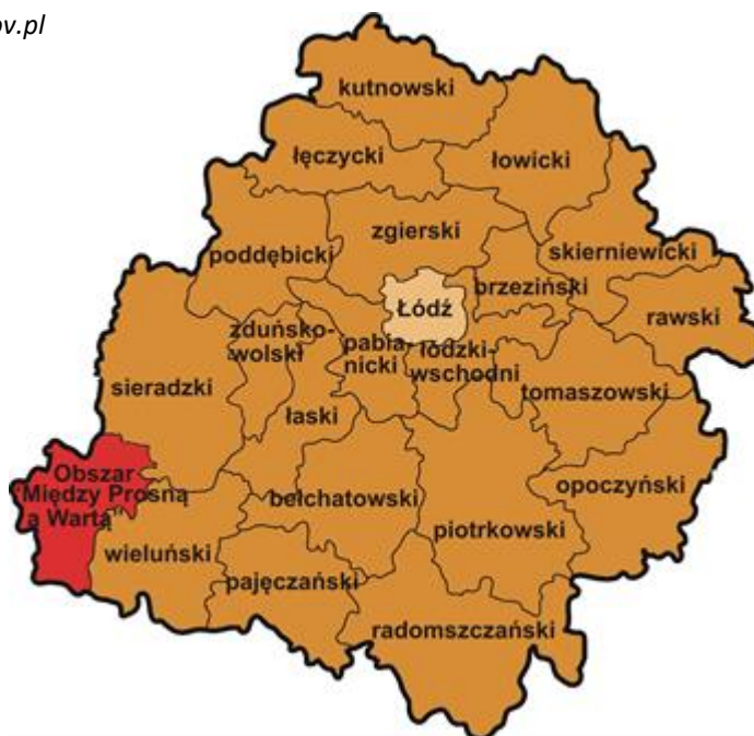
Ryc. 1 Usytuowanie obszaru „Między Prosną a Wartą” na tle mapy powiatów województwa łódzkiego (Opracowanie własne z wykorzystaniem mapki województwa łódzkiego)

Stan na 31.12.2020 r. Źródło http://stat.gov.pl