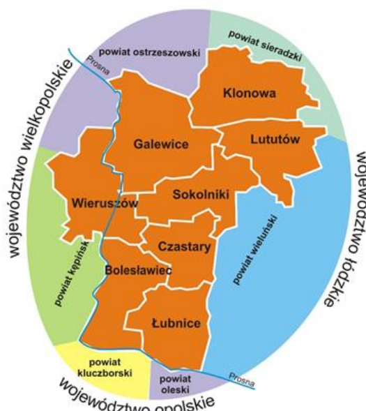
Ryc. 2 Obszar „Między Prosną a Wartą” planowany do objęcia LSR z wyszczególnieniem gmin członkowskich oraz powiatów ościennych (Opracowanie własne)

Całość obszaru leży na terenie Niziny Południowo-Wielkopolskiej, stanowi równinę morenową. Ukształtowanie terenu na całości obszaru jest typowe dla równiny morenowej, czyli lekko pofałdowana powierzchnia terenu (wysokość terenu zawiera się w granicach 150-190 m n.p.m., najwyższe wzniesienie – 202 m n.p.m.). Charakterystyczny jest duży udział terenów rolniczych, zwłaszcza pól uprawnych i występowanie lasów. Jedynym urozmaiceniem krajobrazu jest dolina rzeki Prosną, płynącej przez obszar LSR oraz stanowiącej częściowo granicę pomiędzy Gminami Wieruszów i Galewice. Proсна jest również na pewnych odcinkach granicą obszaru „Między Prosną a Wartą” (co obrazuje Ryc. 2).