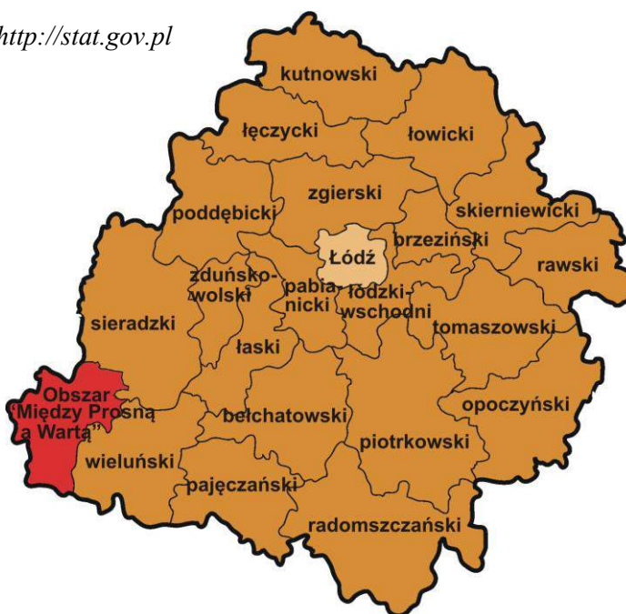
Ryc. 1 Usytuowanie obszaru „Między Prosną a Wartą” na tle mapy powiatów województwa łódzkiego (Opracowanie własne z wykorzystaniem mapki województwa łódzkiego)

Stan na 31.12.2013 r.