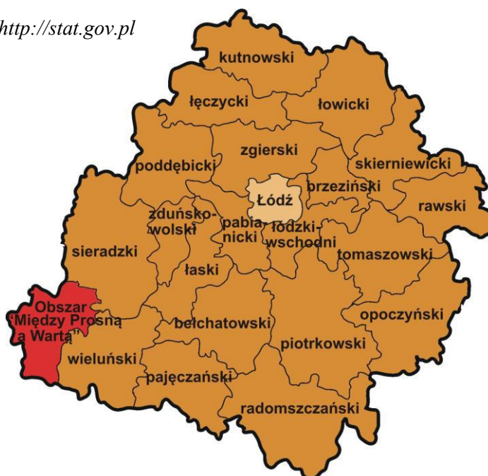
Ryc. 1 Usytuowanie obszaru „Między Prosną a Wartą” na tle mapy powiatów województwa łódzkiego (Opracowanie własne z wykorzystaniem mapki województwa łódzkiego)

Stan na 31.12.2013 r. Źródło http://stat.gov.pl