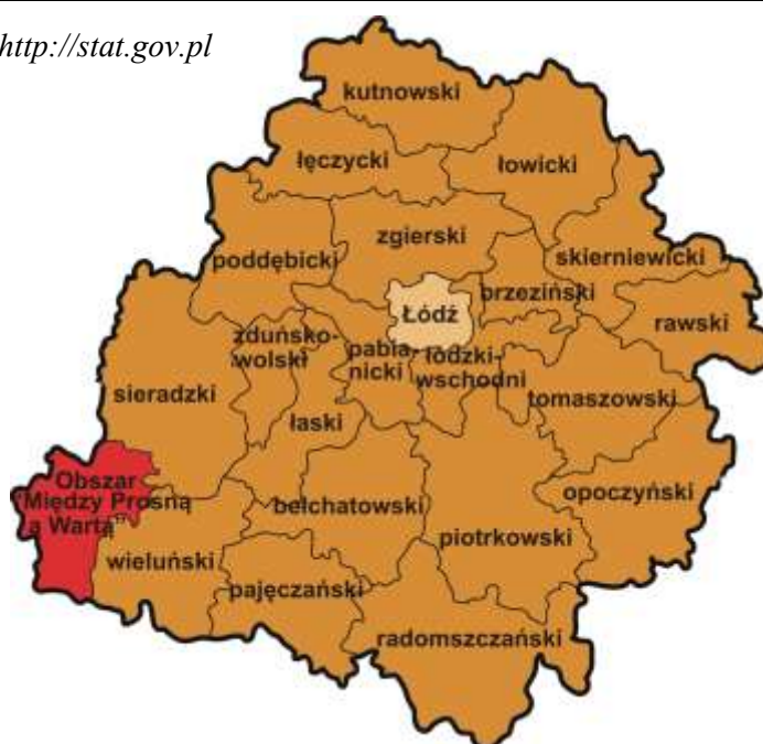
Ryc. 1 Usytuowanie obszaru „Między Prosną a Wartą” na tle mapy powiatów województwa łódzkiego (Opracowanie własne z wykorzystaniem mapki województwa łódzkiego)

Stan na 31.12.2013 r. Źródło http://stat.gov.pl