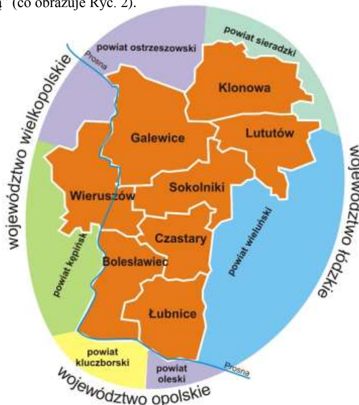
Ryc. 2 Obszar „Między Prosną a Wartą” planowany do objęcia LSR z wyszczególnieniem gmin członkowskich oraz powiatów ościennych ( Opracowanie własne )

Całość obszaru leży na terenie Niziny Południowo-Wielkopolskiej, stanowi równinę morenową. Ukształtowanie terenu na całości obszaru jest typowe dla równiny morenowej czyli lekko pofalowana powierzchnia terenu (wysokość terenu zawiera się w granicach 150-190 m n.p.m., najwyższe wzniesienie – 202 m n.p.m.). Charakterystyczny jest duży udział terenów rolniczych, zwłaszcza pól uprawnych i występowanie lasów. Jedynym urozmaiceniem krajobrazu jest dolina rzeki Prosną, płynącej przez Gminę Wieruszów oraz stanowiącej częściowo granicę pomiędzy Gminami Wieruszów i Galewice. Proсна jest również na pewnych odcinkach granicą obszaru „Między Prosną a Wartą” (co obrazuje Ryc. 2).